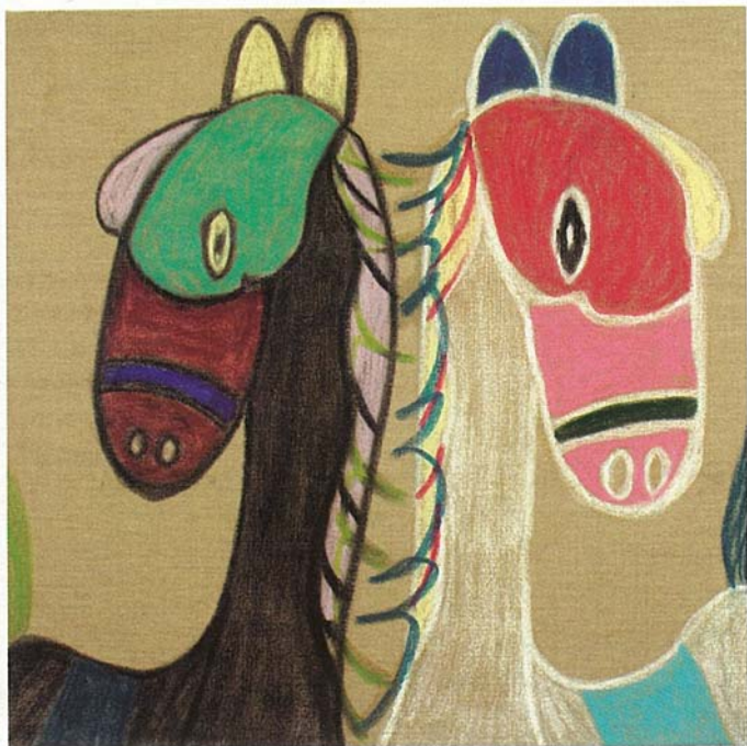
L. Raciti, Cavalli orientali (base lino) , 2006. Pastelli ad olio su tela, cm 70x70.